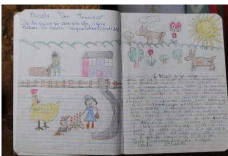
Cuaderno de mensaje

"Lo que me gusta de la maleta itinerante de Don Sapo son los cuentos que la maestra nos cuenta con la marioneta.