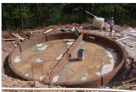
Filtro de arena

Los niños que han participado en esta realización han recibido un diploma como recuerdo de este evento.