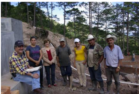
Participantes en la obra