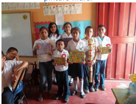
Premiados del concurso de cuentos