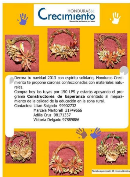
Decoraciones de Navidad realizadas por una artesana hondureña