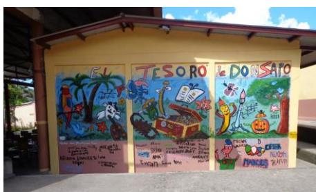
Pintura mural terminada

En el plano cultural, la asociación ha continuado su acción educativa a lo largo del segundo semestre de 2013, organizando actividades que comprenden una participación activa de los niños.