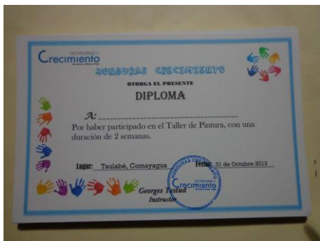
Diploma de participación en la pintura mural