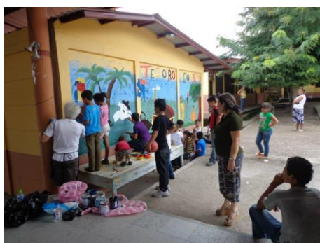
Niños realizando la pintura mural