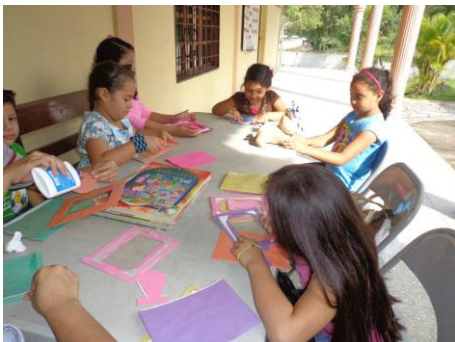
Taller de los niños para Navidad