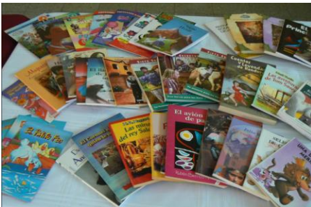
Contenido de la maleta itinerante