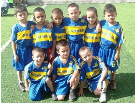
Niños del parvulario Gabriela Mistral