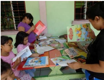
Club de lectura

También se observa un desarrollo significativo en las actividades deportivas. Desde agosto de 2014, Honduras Crecimiento cuenta con el apoyo de una asociación británica «Football Action» con el fin de ampliar las diferentes estrategias de lucha contra el absentismo escolar en las escuelas en zona rural.