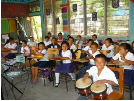
Clase de música en las escuelas, con las percusiones de la caja musical