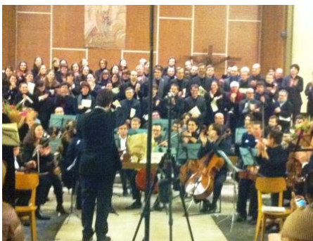
Concierto de «Note et Bien»