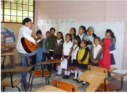
Concierto de fin de curso de los alumnos de la Escuela de Música de Honduras Crecimiento.