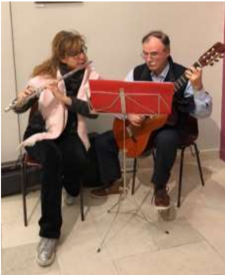
Nazareno tocando la guitarra en el intermedio de la velada teatral