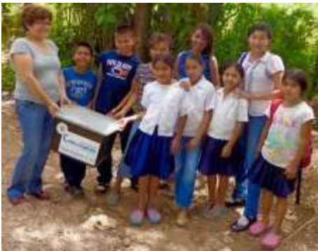
La maleta de Don Sapo llega a la escuela

La maleta viajera ofrece al docente la oportunidad de leer en clase libros de entretenimiento que estimulan la creatividad y la imaginación infantil. La necesidad de esta oferta es aún mayor si se tiene en cuenta que la lectura de entretenimiento no existe en las escuelas rurales. En el mejor de los casos, los niños disponen únicamente de manuales escolares y, en algunos casos extremos, no cuentan con ningún tipo de libro.