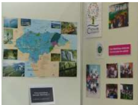
Estand de Honduras Croissance