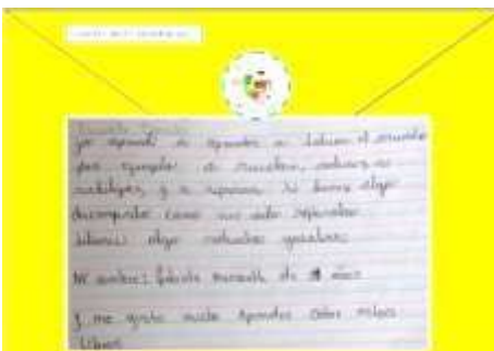
Mensaje de los niños

En el cuaderno de correspondencia de la maleta, los niños depositan mensajes contándonos cuánto disfrutaron al recibir la maleta y cómo aprenden gracias a los libros que contiene.