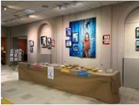
Bufet para una velada teatral cordial