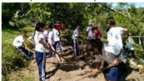
Los niños trabajan en el huerto escolar