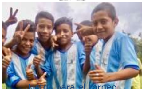
Listos para el torneo

Se ha creado un nuevo logotipo para estas actividades, que se suma a los ya existentes (Honduras Crecimiento, el Tesoro de Don Sapo y Música para Todos) y que está íntimamente ligado al logotipo principal, transmite los valores de la asociación a través de manos multicolores de diferentes tamaños que simbolizan la importancia del voluntariado. La abeja situada en el centro representa el trabajo en equipo, el placer de compartir y la perseverancia.