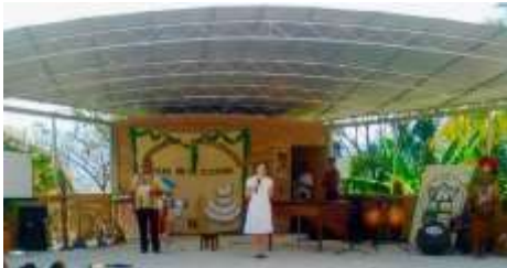
Escenario de la casa de la cultura de San José de Comayagua