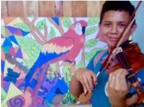
Y del violín