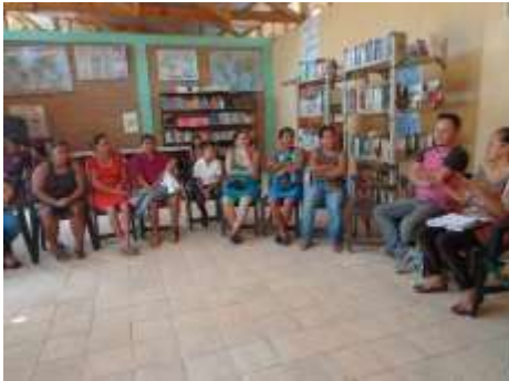
Reunión en la casa de la cultura