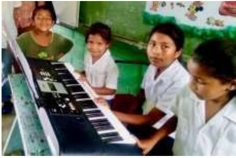
Aprendizaje del piano