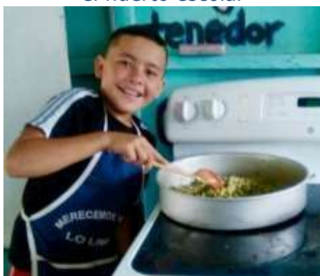
Taller culinario con la verduras del huerto