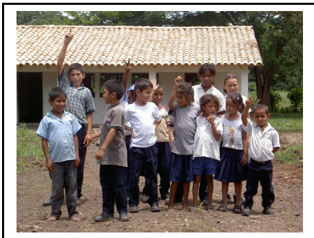
Enfants devant la nouvelle école à Las Maderas

Avec l'aide financière de la Fondation Blancmesnil, deux écoles de 80m 2 (munies d'un bloc sanitaire et de mobiliers neufs) ont été construites dans le département de Comayagua au centre du pays, à Las Maderas et à Loma alta. Ces chantiers ont permis de valoriser les connaissances des villageois en terme de techniques de construction en utilisant les matières premières locales, et leur savoir-faire tout en améliorant les techniques ancestrales.