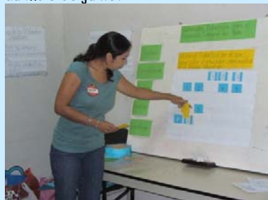
Inauguration Maternelle Agua Fria, au mois d'octobre

Stage pour enseignants du Programme Bâtisseurs d'espoir pour l'élaboration de matériel pédagogique, au mois de juillet