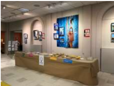
Un buffet pour une soirée théâtre conviviale