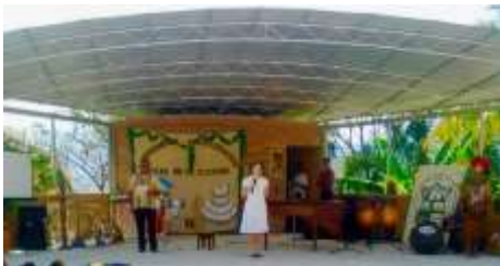
La scène de la Maison de la Culture de San José de Comayagua