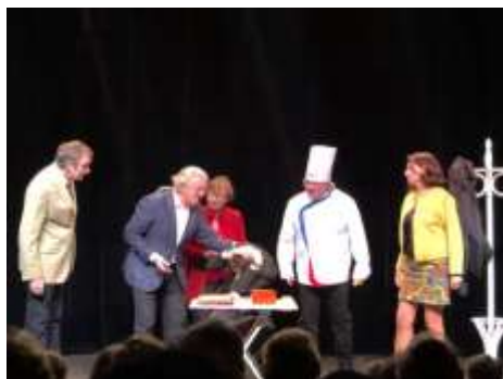
Les acteurs de Gaz à tous les étages

La Compagnie « Gaz à Tous les Etages » a donné deux représentations au Théâtre du Petit Parmentier à Neuilly sur Seine au profit de l'Association Honduras Croissance.