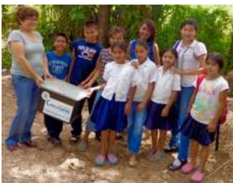
La malle de Don Sapo arrive à l'école

Ainsi Honduras Croissance donne aux maitres la possibilité d'enseigner la lecture aux enfants par plaisir et non par obligation.