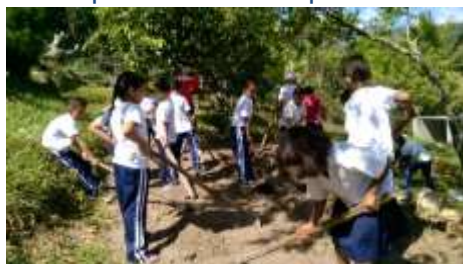
Les enfants préparent le jardin potager