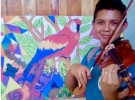
Et du violon