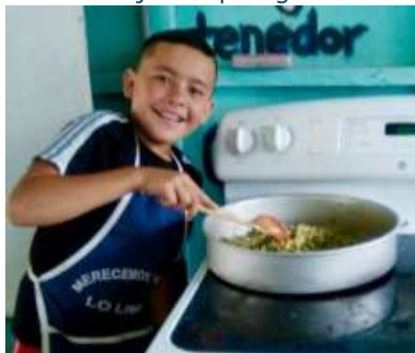
Atelier de cuisine avec les légumes du jardin

Chaque automne, des rencontres sportives mettent en compétition les différentes équipes qui se sont entraînées au cours de l'année scolaire, renforçant ainsi l'esprit de challenge de cette activité.