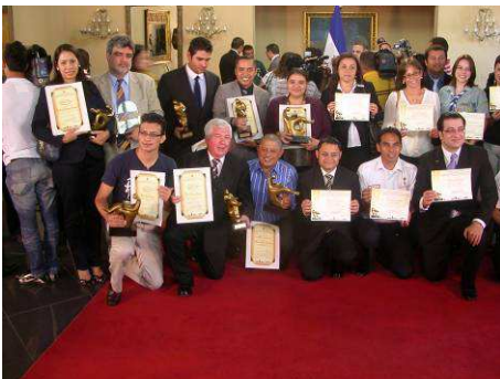
Tous les récipiendaires

Réservez dès à présent cette date, une convocation précisant le lieu et l'heure vous sera adressée prochainement.