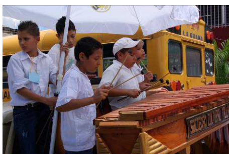
La marimba donne le ton.