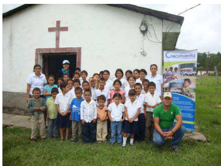
L'école se fait actuellement dans l'église