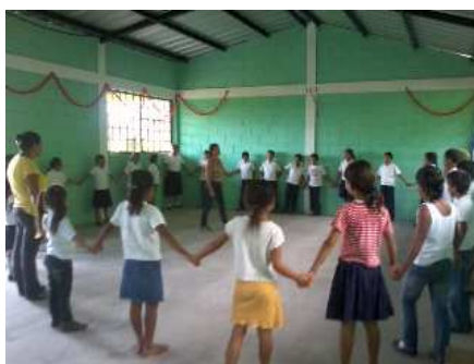
Les enfants miment le conte