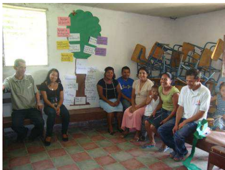
Les villageois devant l'arbre à problèmes

population dans l'identification des besoins du village et la définition des projets à entreprendre. Tous les villageois sont invités à y participer.