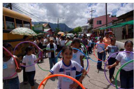
Houla Hop après l'atelier de gymnastique rythmique