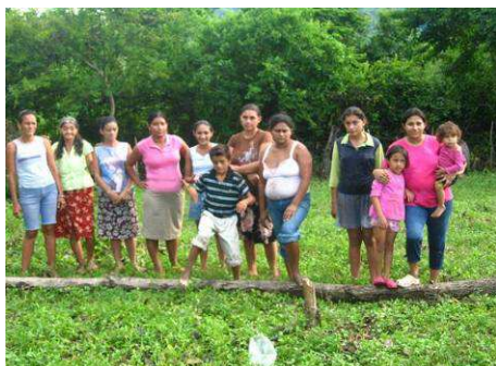
Des parents impliqués