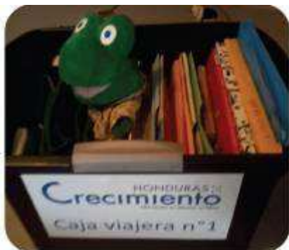
La malle avec les livres et la marionnette