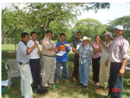
Des bénéficiaires-volontaires décidés

L'association propose déjà un module de formation à la construction en terre, partie intégrante du programme « Bâisseur d'Espoir ». Les habitants sont formés à toutes les étapes de la construction et peuvent ensuite les mettre à leur tour en pratique de manière autonome, soit pour construire leurs logements ou pour bâtir d'autres bâtiments communautaires, soit pour exercer un travail rémunéré.