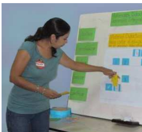
Stage de formation des enseignants

Conformément aux orientations prises lors de l'assemblée générale du 13 mars 2010 qui reconnaissaient l'importance de compléter les enseignements formels par des activités périscolaires, l'Association a réalisé différentes opérations au cours du semestre écoulé dans le but d'élargir et d'améliorer l'enseignement habituellement assuré par les institutrices.