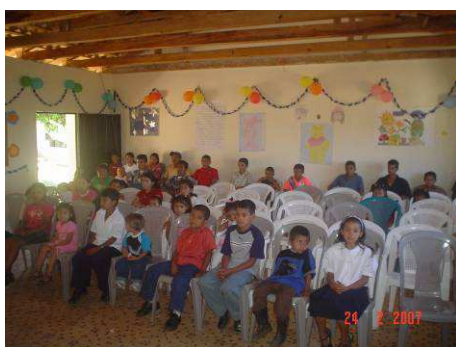
Des enfants participant à la vie de la communauté