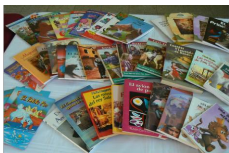
Contenu d'une malle