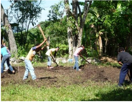
Mise en place d'un potager