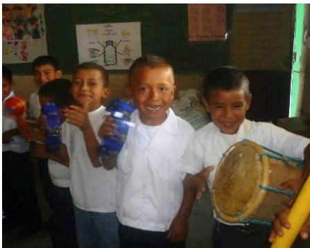
Les enfants de l'école La Laguna avec les instruments de la caisse musicale de HC