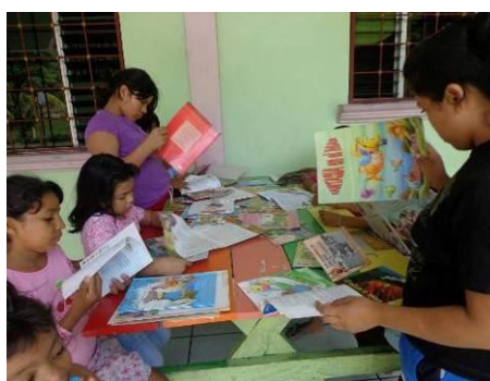
Le Club de lecture