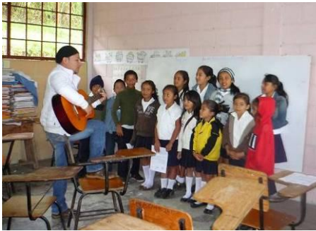
Concerts de fin d'année des élèves de l'École de Musique de Honduras Croissance