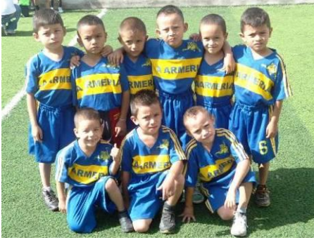
Les enfants de la maternelle Gabriela Mistral