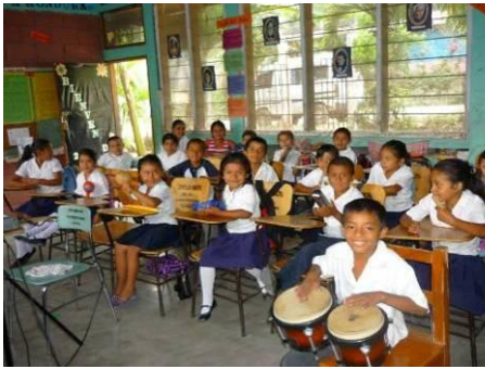
Cours de musique dans les écoles avec les percussions de la caisse musicale